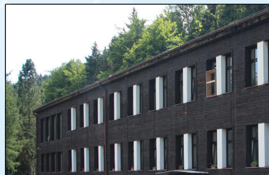
ÚV III. Mlýn

Osoby mladší 18 let mají vstup na vodní díla povolen pouze v doprovodu za ně odpovědných dospělých.